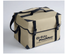
8 LITRES PAYLOAD