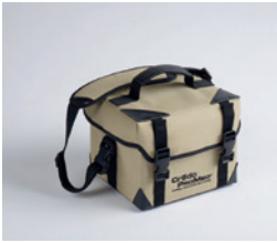
2 LITRES PAYLOAD