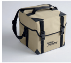
4 LITRES PAYLOAD